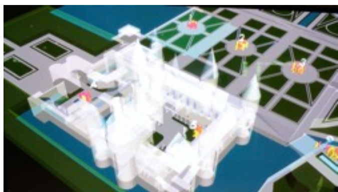
3/ Visualiser en temps réel Diffusion 3D animée des votes-avatars en mobilité