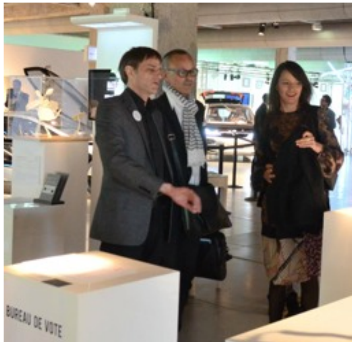
1/ Accueillir le public Agencement sur mesure du Bureau de vote