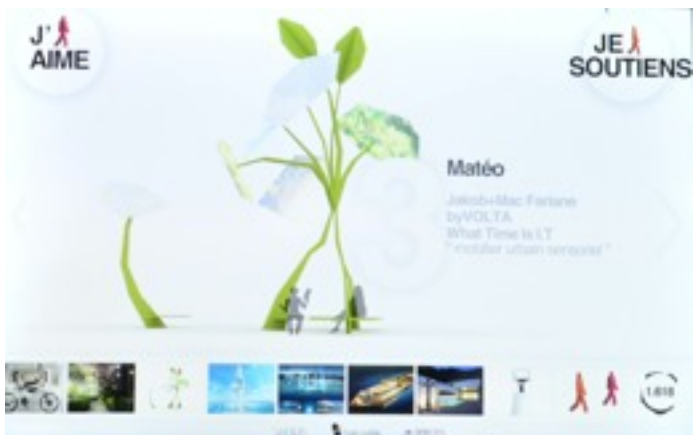
2/ Voter Interface de vote et de consultation des projets